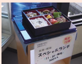
(ランチのディスプレイ)