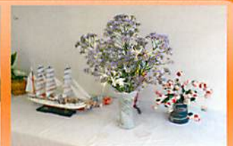
フラワーアレンジメント